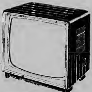
23TX328A Aantrèkkelijk symmetrisch tafelformaat met 59 cm beeldbuis. Rotsvast, helder en contrastrijk beeld wordt gegarandeerd door een aantal kwaliteitsfeatures, zoals DUBBELE automatische synchronisatie, automatische beeldhoogte- en beeldbreedte-instelling, en MemoMatic Fijnafstemming.